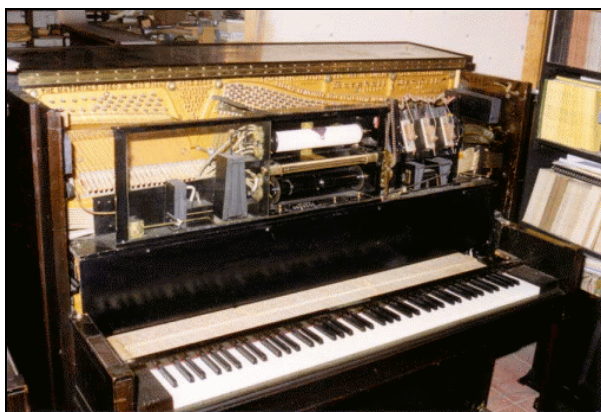
La pianola di Nancarrow

– Vorrei sottolineare fortemente che questo non è che un esempio: un modo di cominciare un discorso che poi può evolversi in molteplici direzioni. Si pensi soltanto alle poliritmie più complesse – che risultano spesso indominabili da parte degli strumentisti se non ricorrendo ad artifici come metronomi in cuffia, ed anche in questo caso con risultati esecutivi talvolta piuttosto dubbi. Il nome di Conlon Nancarrow (1912–1997) si impone da sé sia per il tipo di ricerca ritmica sia per il fatto che egli comprese la necessità di rivolgersi per la realizzazione dei suoi progetti alla pianola meccanica (Serra, 2008).