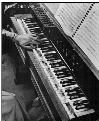
Chromelodeon I (Partch, 1949)

Non meno esemplare da questo punto di vista è il nome di Harry Partch (1901–1974). Già nel primo quarto del secolo XX si cominciarono a compiere esperimenti che prevedevano l'impiego di quarti o dei terzi di tono, ma essi ebbero breve respiro, forse perché alla fine ritenuti poco interessanti musicalmente, forse per le difficoltà esecutive che essi non potevano che presentare. Harry Partch dovette escogitare strumenti appositi per riprendere forme scalari estranee al sistema temperato ed in particolare per l'ottava suddivisa in 43 microtoni.